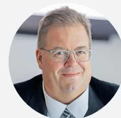
Marco Jansen Oberbanscheidt & Cie